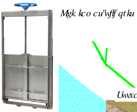
Mgk kco cu'wfff qt ku