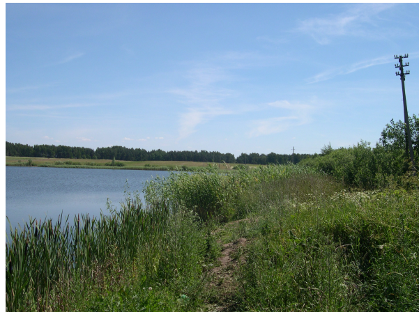
Bendras planuojamos teritorijos vaizdas.