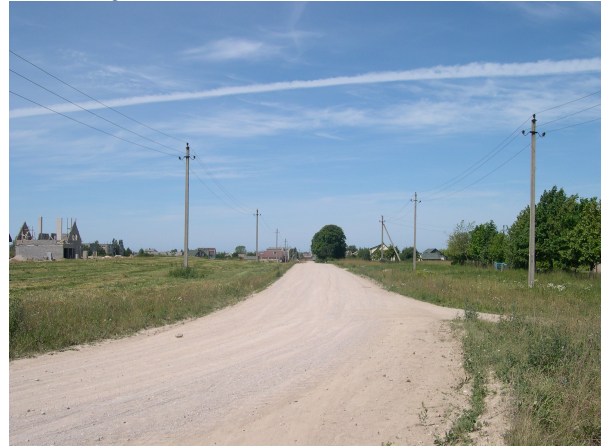
Bendras planuojamos teritorijos vaizdas.