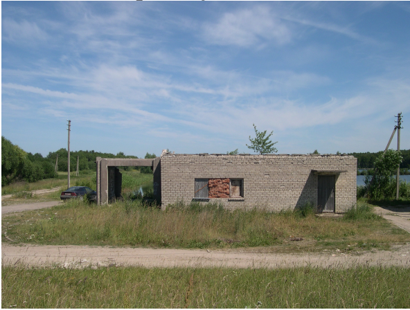
Bendras planuojamos teritorijos vaizdas.