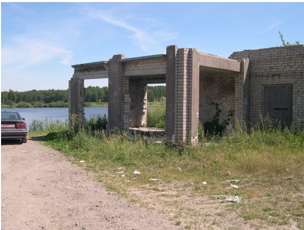
Bendras planuojamos teritorijos vaizdas.