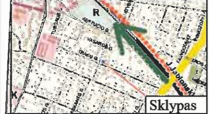
Ištrauka iš Kretingos miesto BP aukštybinių pastatų, vertikalų akcentų išdėstymo, prekybos centrų brėžinio