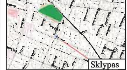
Ištrauka iš Kretingos miesto BP kraštovaizdžio tvarkymo rekreacijos ir turizmo brėžinio.