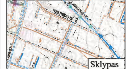
Ištrauka iš Kretingos miesto BP inžinerinės infrastruktūros ir susisiekimo komunikacijų brėžinio